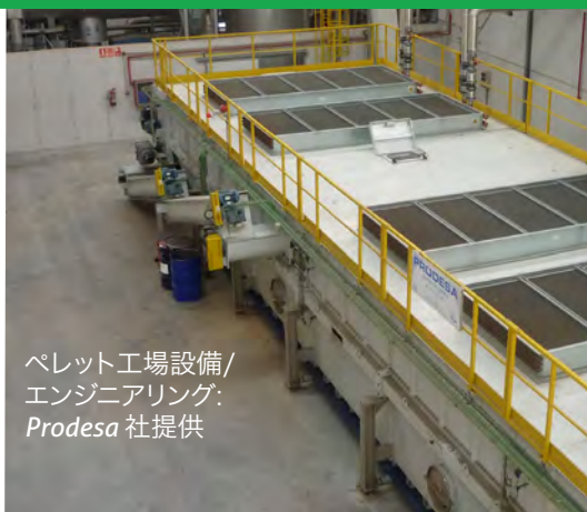
ペレット工場設備/ エンジニアリング: Prodesa 社提供