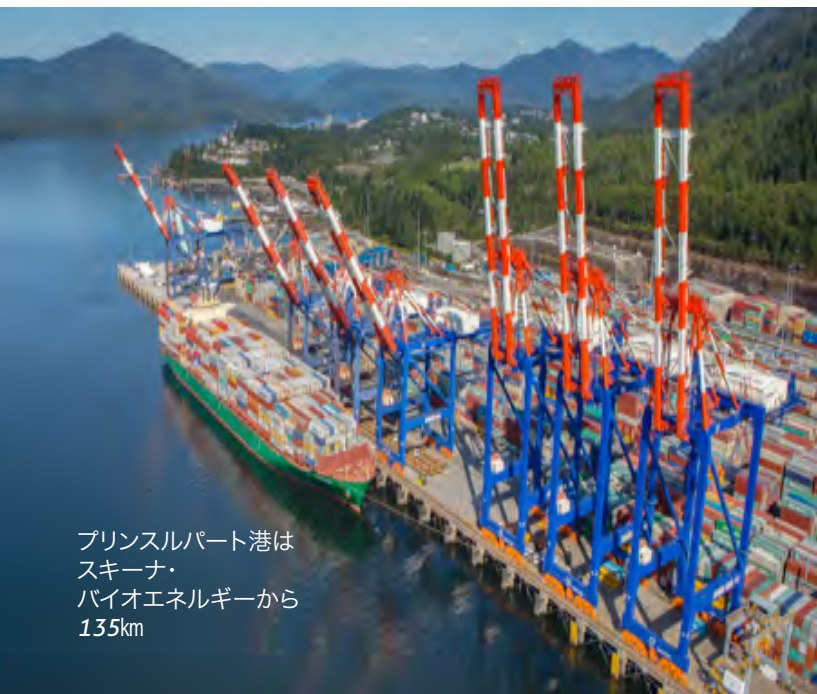
プリンスルパート港は スキーナ・ バイオエネルギーから 135km