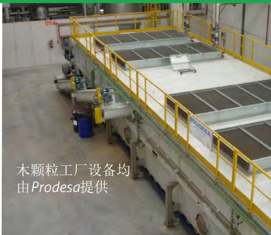
木颗粒工厂设备均由Prodesa提供